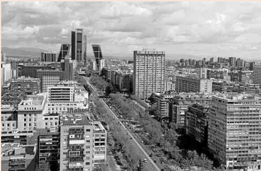
Centro de negocios en el Paseo de la Castellana de Madrid.

Comportamiento dispar Por otra parte, entre los 10 y los 20 millones de euros se encuentran once firmas con comportamientos muy dispares. De este grupo sobresale Ramón y Cajal, que roza casi los 20 millones (19,91). En el