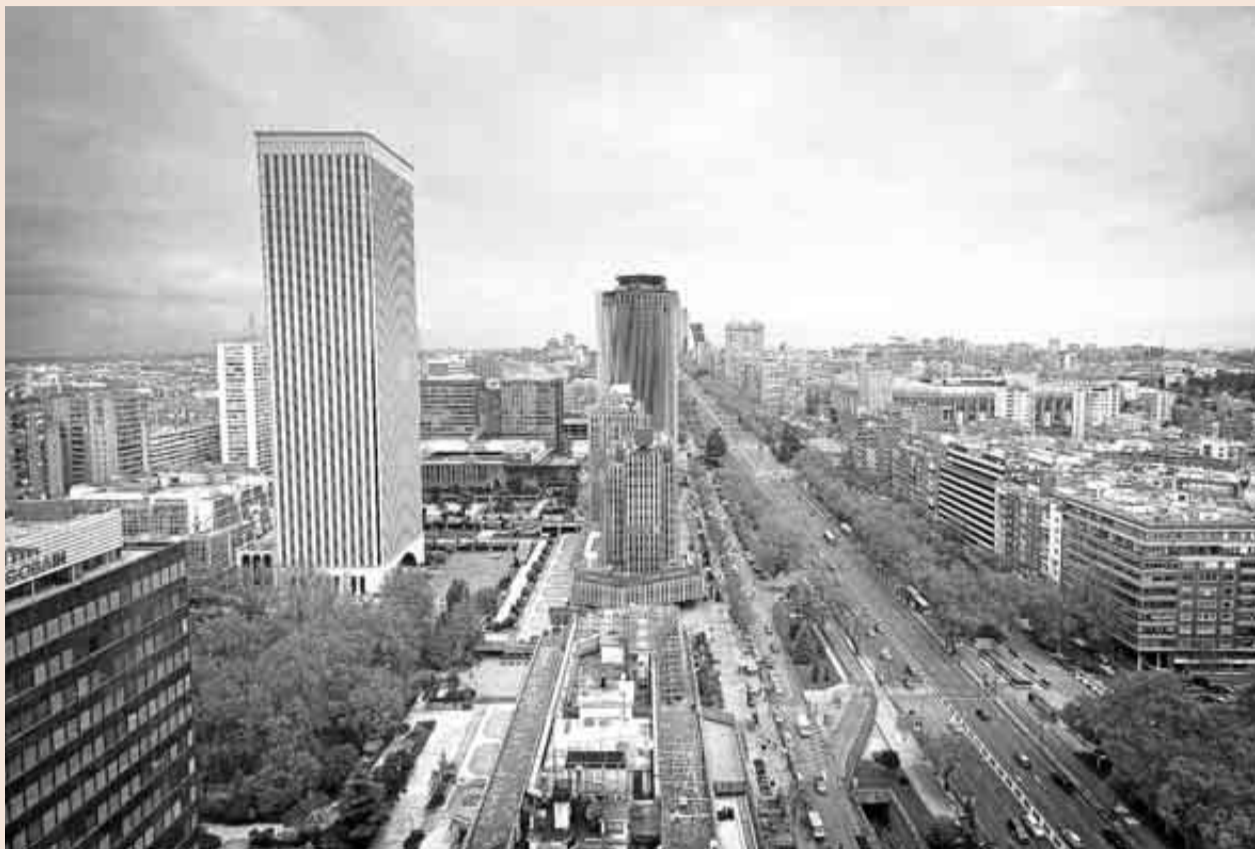
El Paseo de la Castellana de Madrid concentra la mayoría de las sedes de los principales bufetes de la abogacía de los negocios en España.

Analizando los despachos de abogados presentes en la clasificación de este año, observamos como Garrigues logra auparse de nuevo a lo